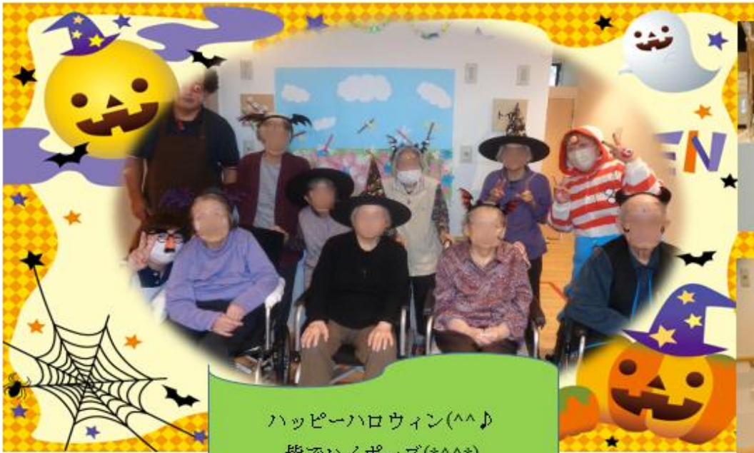
ハッピーハロウィン(^^♪ 皆でハイポーズ(*^^*)