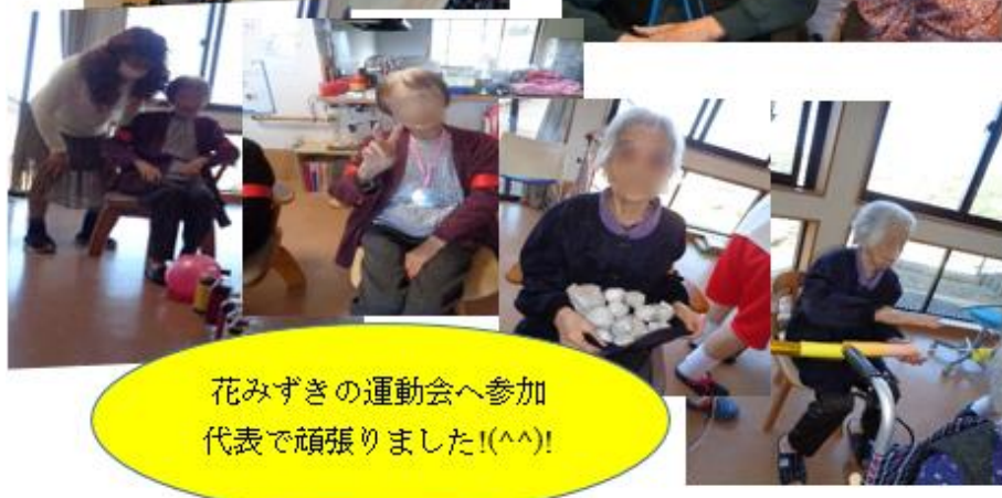
花みずぎの運動会へ参加 代表で頑張りました!(^^)!